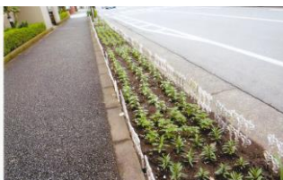
園芸・美化グループの方々が、バス通りの花壇を、夏の花に植え替えました!!

第4号・5号議案が承認され、全ての議事が終了し、議長・書記が解任され、総会は閉会となりました。