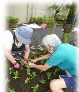
バス通りの車を用心しながらの作業です。