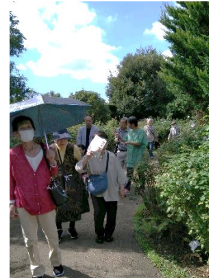
高い秋の空！バラ園散策