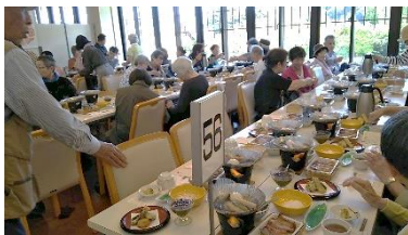
次の目的地は鈴廣かまぼこの里。