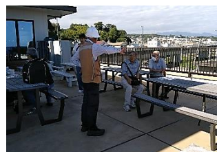
「漁港の駅TOTOCO小田原」でくつろぐ

日本初の漁港の駅で、漁港直送の鮮魚・活魚など、地場物産販売コーナーが充実しており、皆たくさんお土産を買って帰りました。