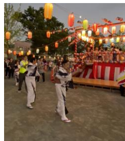
★今年は昭和薬科大学のボランティアの学生さんが大勢参加して大きな盆踊りの輪ができました