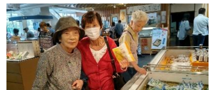
買い物を楽しむ人、ドリンクコーナーで喉を潤す男性、おしゃべりに興じる女性たち、それぞれが豊かな時間を過ごしました。