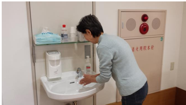
創和会正面玄関をって右側にあります